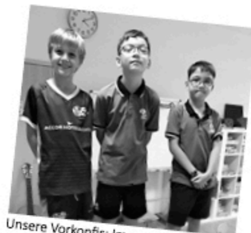
Unsere Vorkonfis: Immer munter dabei!

Im Gottesdienst am 17. Februar um 16.30 Uhr in der Kapelle der ORPC* zeigen die 10 Vorkonfis, was sie im vergangenen halben Jahr alles gelernt haben!