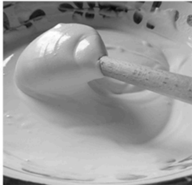
Nie mehr an Quarkmangel leiden: Machen Sie mit beim Mini-Seminar über Joghurt und Quark im Pfarrhaus!

Das Seminar findet statt am Samstag, 16. Februar um 11 Uhr im Pfarrhaus Faber Garden*. Wir bitten um Anmeldung bis 14.2. unter evkirche.sg@gmail.com . Das Seminar ist kostenfrei – wir bitten um eine Spende.