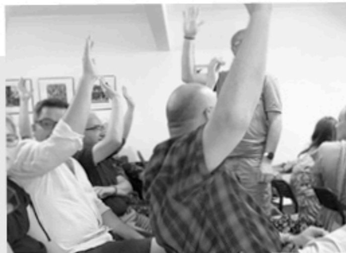
Unsere Gemeinde mitgestalten