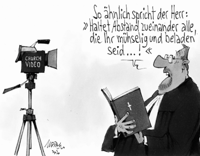
FRÖHE BOTSCHAFT IN CORONA-ZEITEN