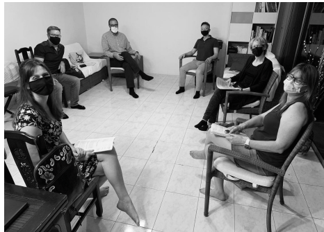
Sitzung des Gemeinderats im März

Sie können das Protokoll der Gemeindeversammlung auf unserer Website herunterladen oder folgen Sie dem QR-Code.